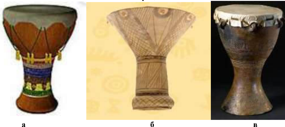
Рис. 1. Археологічні барабани келихоподібної форми (3600–1290 рр. до н.е.): а – Єгипет; б – Китай; в – Чехія