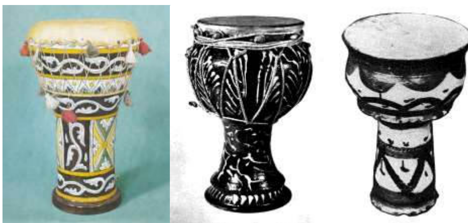
Рис. 2. Сучасні народні барабани келихоподібної форми