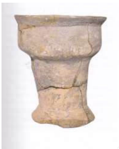
Рис. 3. Трипільський барабан келихоподібної форми (4600 р. до н.е.)